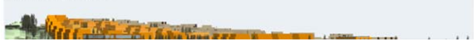
Schnitt Die West durch den Necker Blockbauweise Norden 1:500